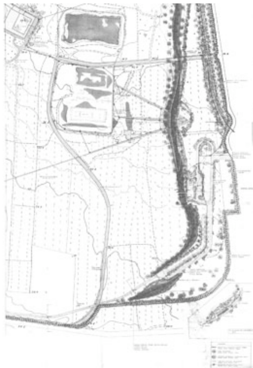
F. Minissi, P. Porcinai, M. Arena, progetto dell'ingresso al del Parco archeologico di Selinunte, 1981. Planimetria generale dei rilevati con l'indicazione dei percorsi carrabili e pedonali, dei parcheggi e della vegetazione.