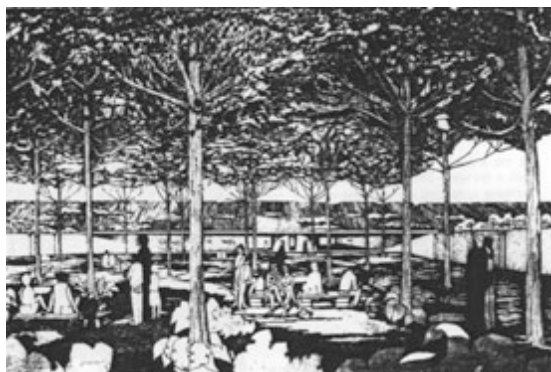
F. Minissi, P. Porcinai, M. Arena, Veduta dello spazio di ingresso al Parco archeologico di Selinunte, 1981

La città non ha mai accettato di buon grado quest'opera e fortissimi furono i contrasti tra Soprintendenza e Amministrazione comunale per quella che, da una parte, era ritenuta un'opera di salvaguardia di un bene che rischiava di essere distrutto dall'avanzare delle nuove costruzioni, e dall'altra invece la negazione di un diritto, quello di fruire liberamente di un sito da sempre patrimonio della cultura locale.