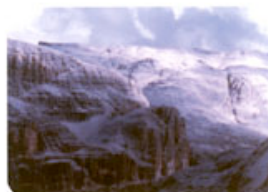
➤ Approccio al tema